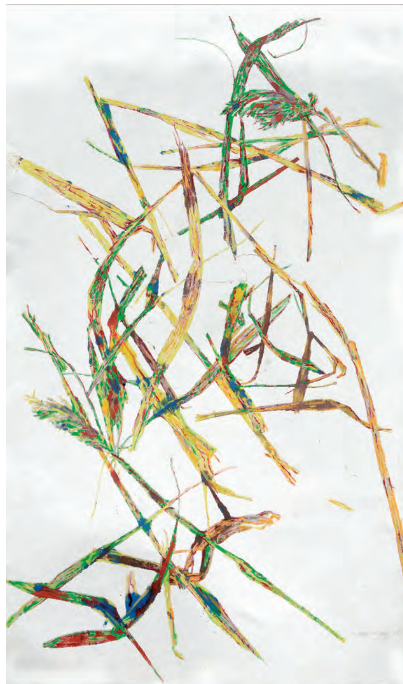
ANJU CHAUDURI / ROSEAUX 2009 / Huile sur toile / 130 x 81 cm © Michel Mathieu