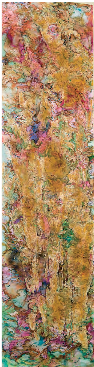
ANJU CHAUDURI / SCROLL 2009 / Technique mixte sur papier japonais 135 x 35 cm © Michel Mathieu

I l y a dans cet art une réflexion très fine sur la nature, les vibrations de ses couleurs, l'ordonnance de ses lignes. Une sagesse millénaire s'exprime dans un regard confiant en la beauté des choses mais conscient de sa précarité. Le cérémonial du poème oriental a toujours eu la pudeur de laisser à son lecteur le soin de comprendre. Les Paysages de Chaudhuri prennent parfois l'aspect de certaines photographies au scanner : cellules vivantes, textures microscopiques dont l'agitation, biologiquement ou mathématiquement ordonnée, exprime la fièvre de l'infiniment petit mettant en place l'existence.