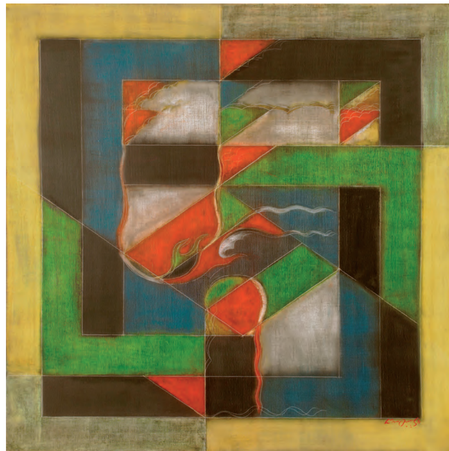
NARAYANAN AKKITHAM / SANS TITRE 2011 / Huile sur toile / 100 x 100 cm