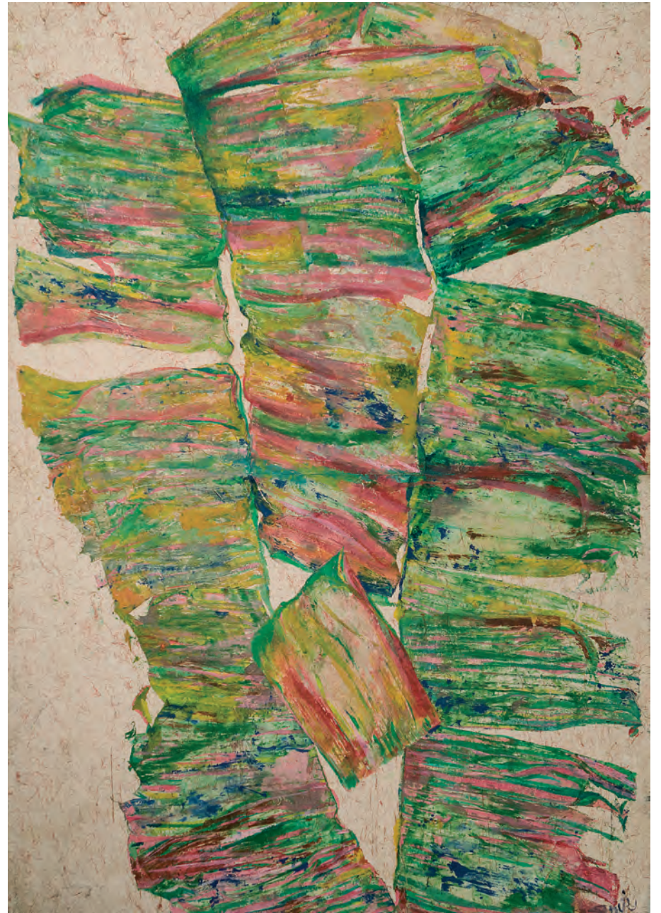
ANJU CHAUDURI / FEUILLE DE BANANE 1992 / Huile sur papier marouflé / 110 x 77 cm © Michel Mathieu