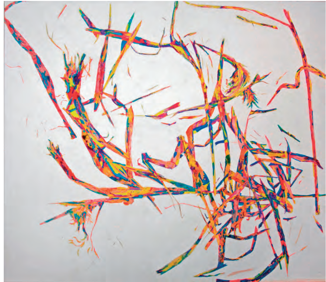
ANJU CHAUDURI / ROSEAUX 2008 / Acrylique sur toile / 110 x 132 cm